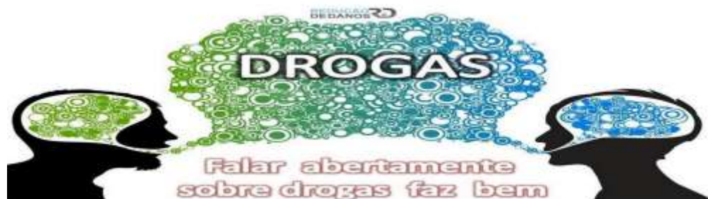
Imagem 2 – Falar abertamente sobre drogas desenvolve o senso crítico e a autonomia dos jovens, sem amedrontá-los.

A redução de danos fundamenta-se nos princípios de pluralidade democrática, no exercício da cidadania e no respeito aos direitos humanos e de saúde. As ações educativas buscam promover a reflexão e o diálogo sobre o uso de diferentes tipos de drogas, legalizadas ou não, de forma circunstanciada e contextualizada. Orientada pela compreensão que parte dos usuários não consegue, não pode ou não quer interromper o consumo, procura soluções capazes de reduzir os eventuais prejuízos do uso. Parte do princípio que as pessoas vivem em contextos diversos de vulnerabilidade e que a fragilidade não é algo apenas individual, mas coletiva e socialmente construída.