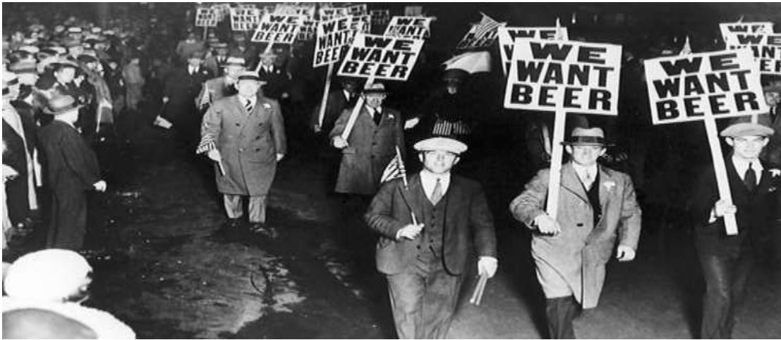
Imagem 1 – Movimentos de revolta contra a Lei seca nos Estados Unidos na década de 1920.

alcoólicas, dando início à internacionalização do crime organizado e consolidando a clandestinação do álcool e outros psicotrópicos considerados ilícitos.