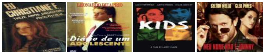
Figura 2 – Capa dos Filmes sobre drogas mais sugeridos na semana 6

frenético, Bulling – provocações sem limite, Scarface , Cazuza, Quebrando o tabu 3 (documentário), Profissão de risco, Queimando tudo, Os filhos do crack (documentário), A história da maconha, Réquiem para um sonho, Sem limites, Obrigado por fumar, Maria Cheia de Graça, Tropa de Elite, Anjos do sol, Voo, Traffic e Cidade de Deus.